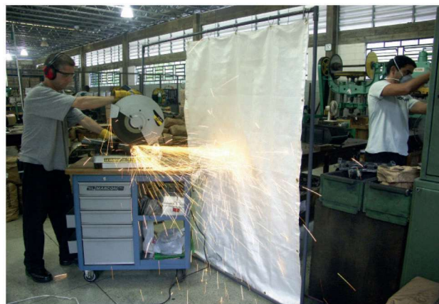
Segurança dos operadores e máquinas nas operações de corte.