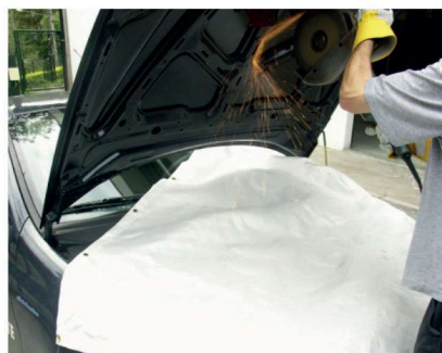
Partes importantes dos veículos protegidos de fagulhas e faíscas nas operações de esmerilhamento.