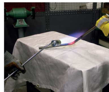
Proteção das bancadas nas operações de aquecimento.