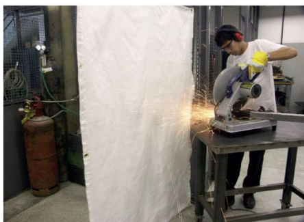
Cilindros de gás protegidos de fagulhas e faíscas.