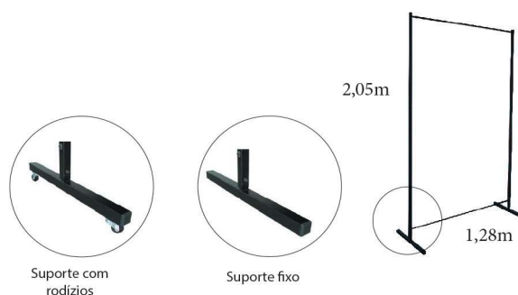
Suporte com rodízios

Fabricamos sob encomenda suportes em medidas especiais. Solicite os códigos dos produtos.